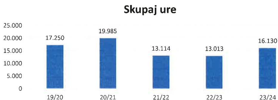
Graf 1: Gibanje skupnega števila realiziranih ur v obdobju od leta 2019/20 do 2023/24