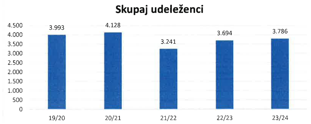
Graf 2: Gibanje skupnega števila udeležencev od 2019/20 do 2023/24